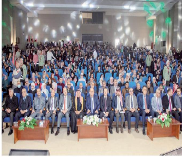
جانب من احتفال الجامعة الهاشمية بميلاد الملك وذكرى الكرامة

الحيارى: كرامة الأردن مصونة بدماء أبنائه وقلوب رجالها التي لا تعرف الهوان