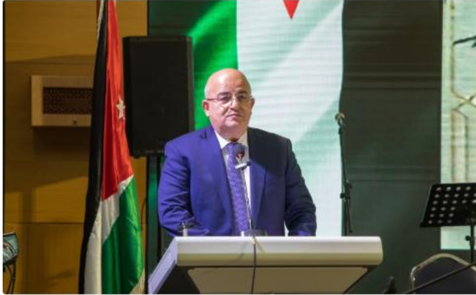
نبأ الأردن - وليد حماد

الاقتصاد | 2026-03-31 | 03:24 pm - الثلاثاء